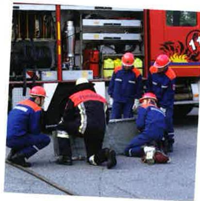
Mit meiner Unterstiftung kann ich das bürgerschaftliche Engagement unterstützen.

Persönlich: Die Unterstiftung kann Ihren Namen tragen oder sie kann über die Namensgebung an bereits verstorbene Angehörige erinnern. Wenn Sie es wünschen, können Sie Ihre Unterstiftung auch persönlich repräsentieren, z. B. bei der Scheckübergabe an die geförderte Einrichtung.